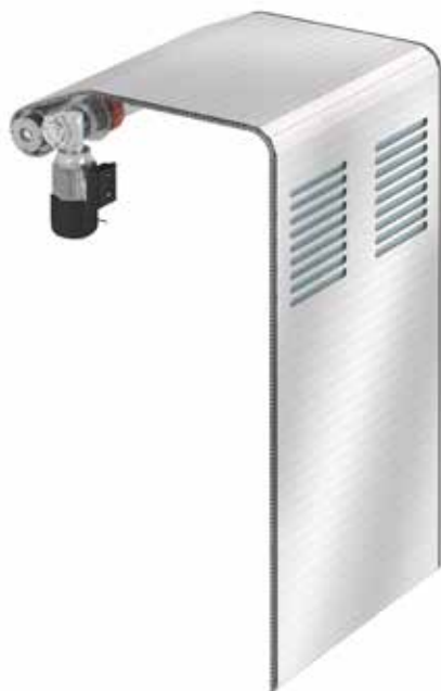
Tapparella motorizzata Corner Roll Up Cover.

nuove politiche in merito al codice di condotta, la salute, il benessere e la soddisfazione dei dipendenti.