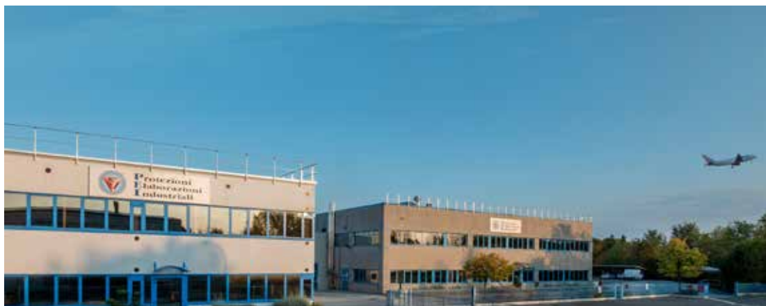
Sede PEI Calderara di Reno [Bologna].

Via Torretta 32-32/2-34-36 40012 Calderara di Reno (BO) Tel. +39 051 6464811 Fax: +39 051 6464840-41 info@pei.it - www.pei.it Padiglione 14 - Stand E09