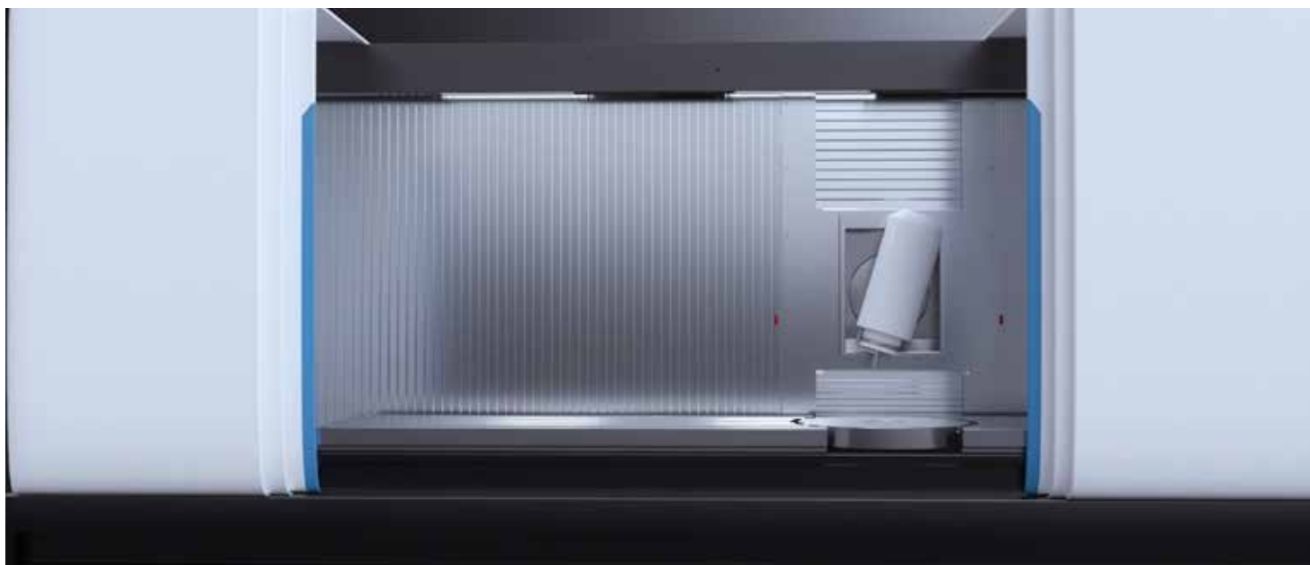
Scudo con nuovo soffietto con lamelle Unque Steel Cover EVO montato su macchina utensile.

L'impegno di PEI per la sostenibilità delle persone è costante, dal 2020 ha introdotto